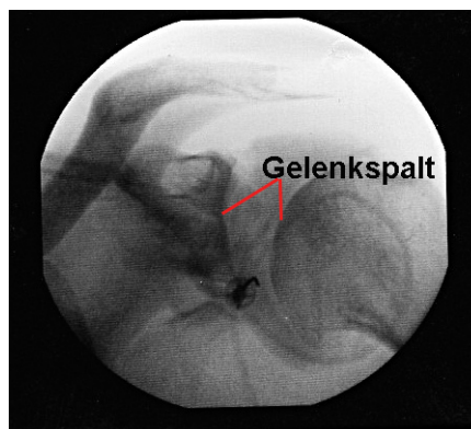
Nach Hydro: aufgedehnter Gelenkspalt